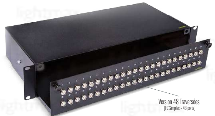
Version 48 Traversées [FC Simplex - 48 ports]

[Images uniquement pour des fins de référence]