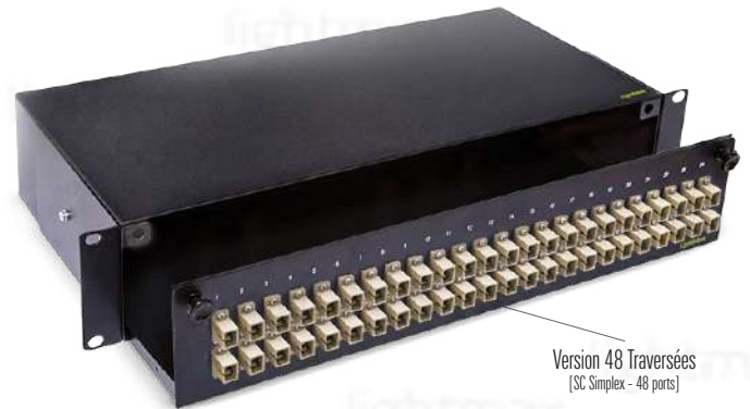
Version 48 Traversées [SC Simplex - 48 ports]

[Images uniquement pour des fins de référence]