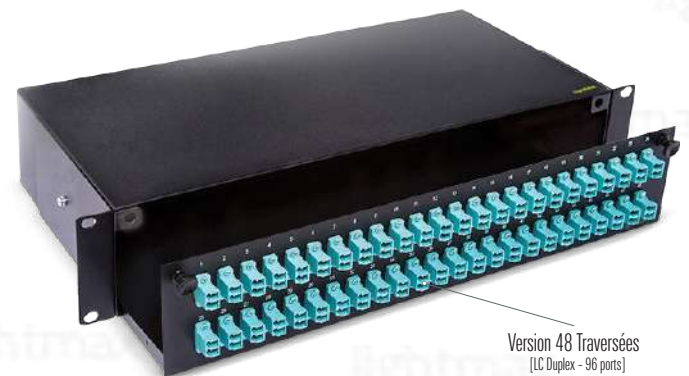
Version 48 Traversées [LC Duplex - 96 ports]

[Images uniquement pour des fins de référence]